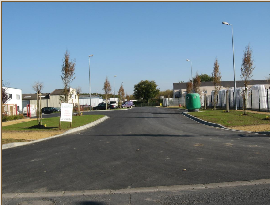
ZA de la Châtaigneraie après travaux