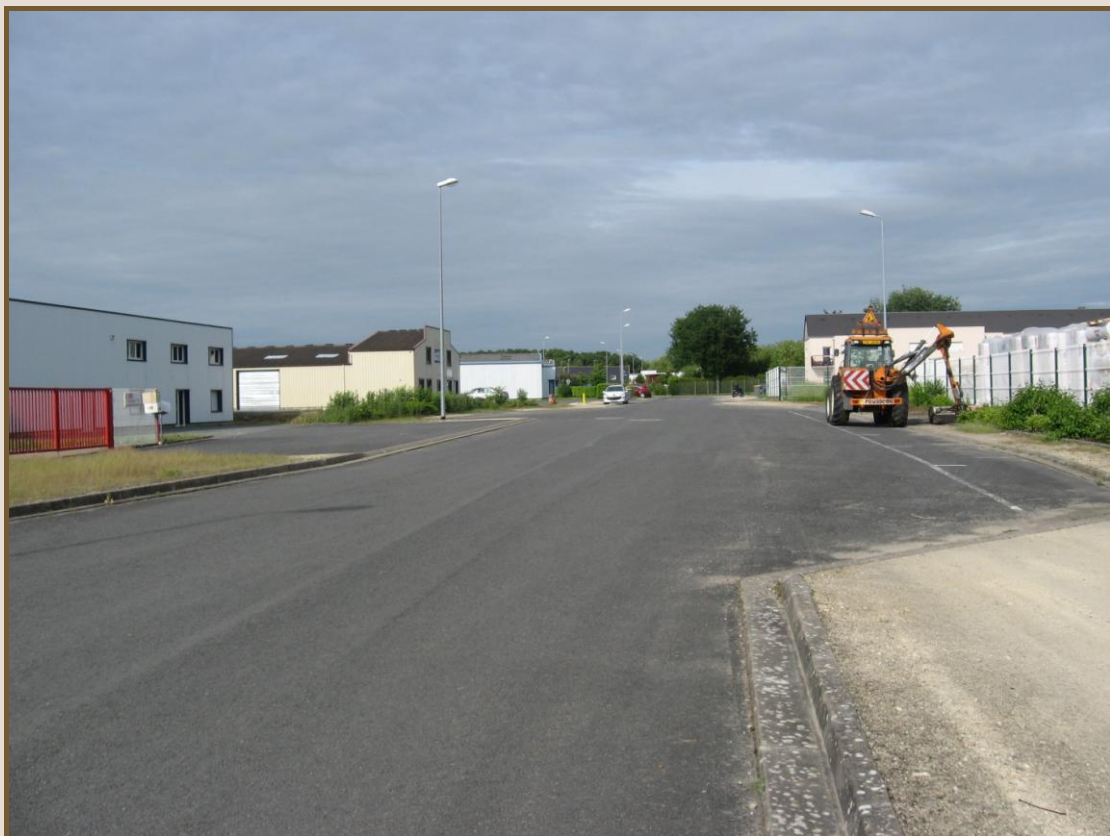
ZA de la Châtaigneraie avant travaux