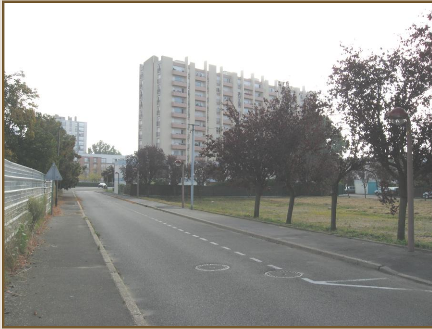
Rue des Vosges avant travaux