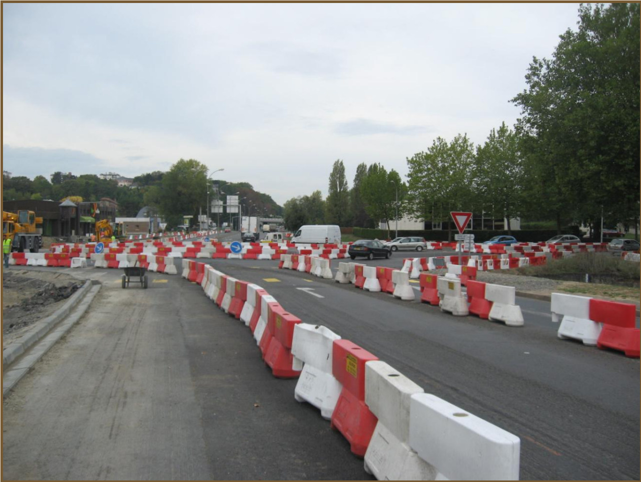
Giratoire en cours de travaux